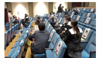
後半グループ・ディスカッションの様子