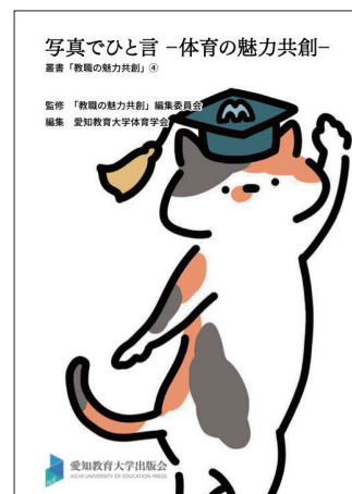
愛知教育大学出版会 社会領域編 ¥990(税込)